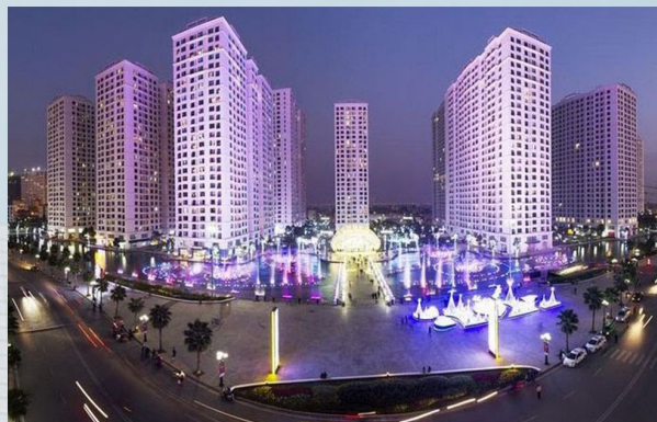
TIME CITY - VINGROUP