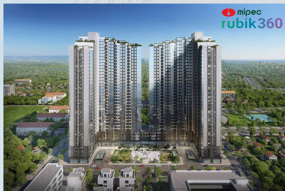
MIPEC RUBIK 360 MIPEC GROUP