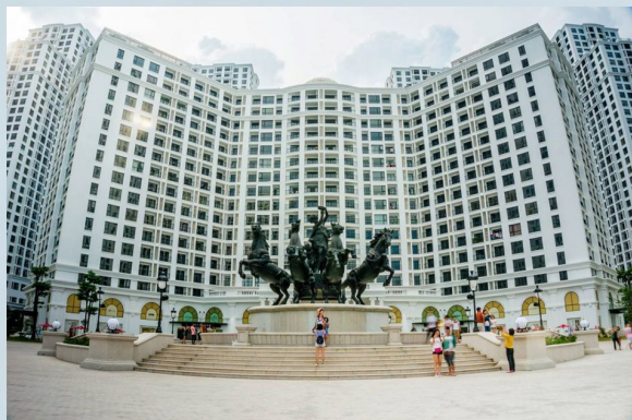
ROYAL CITY - VINGROUP