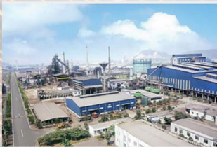
Nhà máy Thép Hòa phát