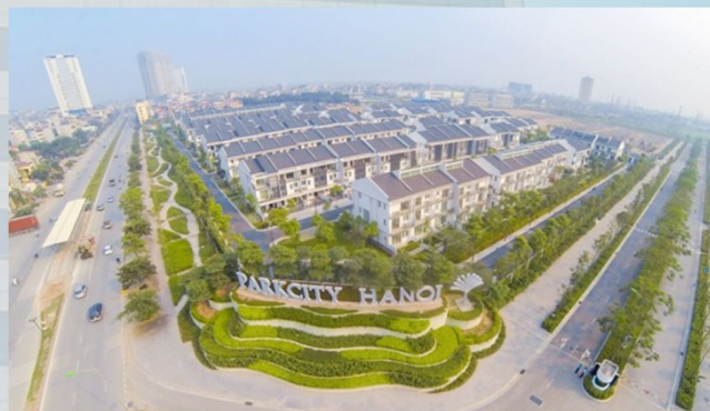
PARK CITY CÔNG TY CP PT ĐÔ THỊ QUỐC TẾ VIỆT NAM