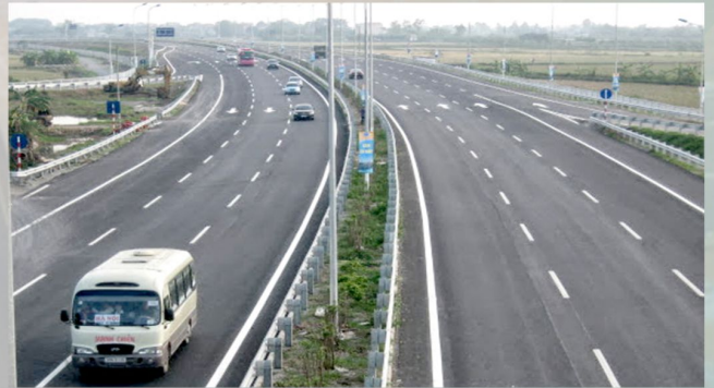
CAO TỐC PHÁP VÂN CẦU GIỀ