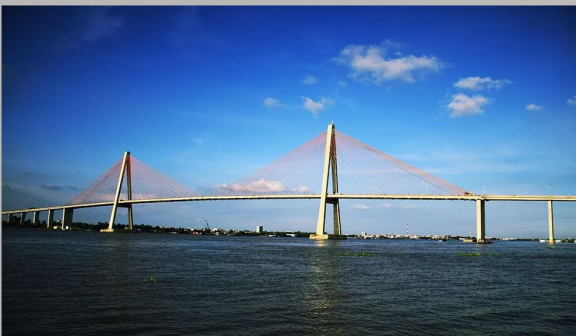
CẦU RẠCH MIÊU BẾN TRE