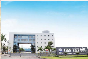
Nhà máy Việt Đức