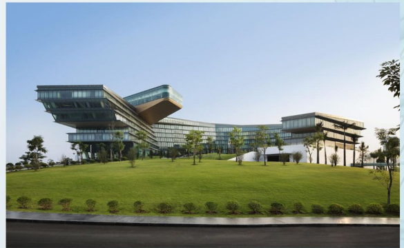
JW MARRIOTT HOTEL HÀ NỘI