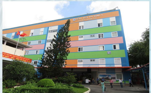
BỆNH VIỆN NHI ĐỒNG I