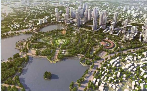
KĐT MANOR CENTRAL PARK BITEXCO GROUP