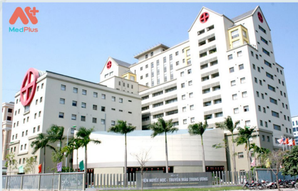
VIỆN HUYẾT HỌC VÀ TRUYỀN MÁU TRUNG ƯƠNG