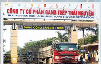
Nhà máy Thép Thái Nguyên (Tisco)