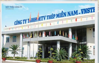
Nhà máy Thép Miền Nam