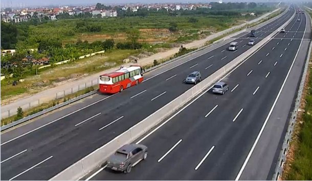
CAO TỐC HÀ NỘI HẢI PHÒNG