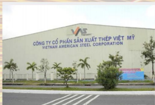
Nhà máy Thép Việt Mỹ (VAS)