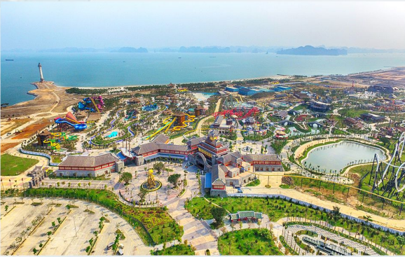
SUNWORLD PARK HẠ LONG