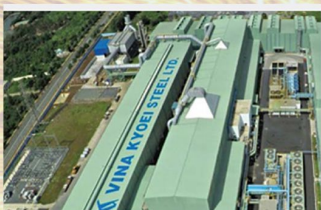
Nhà máy Thép VINA KYOEI