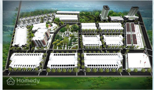
KĐT HƯNG PHÚ HOMEDY BẾN TRE