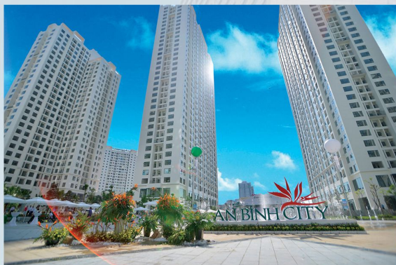
AN BINH CITY TỔNG CÔNG TY XÂY DỰNG HÀ NỘI