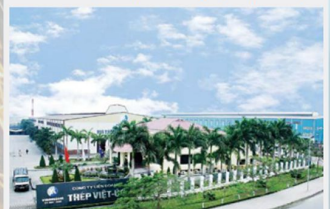
Nhà máy Thép Việt Úc