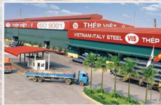
Nhà máy Thép Việt Ý