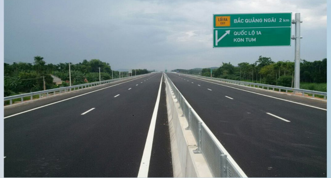
CAO TỐC ĐÀ NẴNG QUẢNG NGÃI