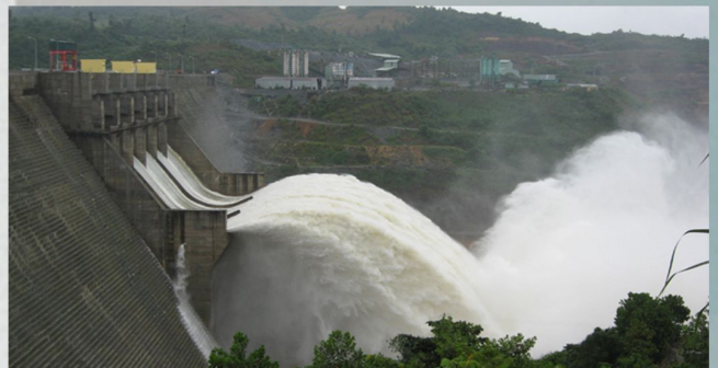
THỦY ĐIỆN SÔNG TRẠNH 2