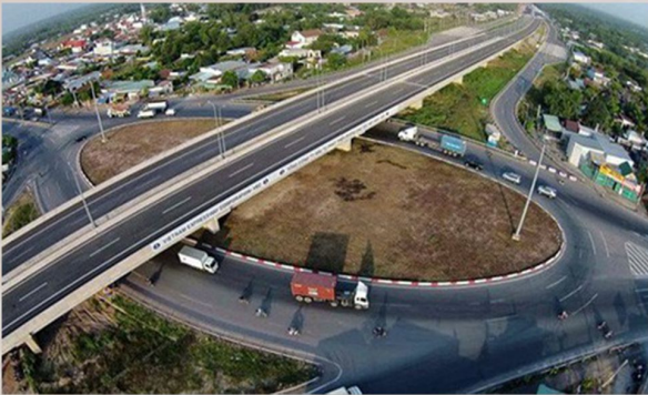
CAO TỐC TRUNG LƯƠNG CẦN THƠ