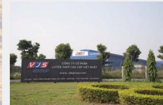
Nhà máy Thép Việt Nhật (VJS)