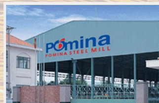
Nhà máy Thép Pomina