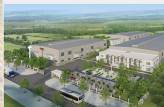
Nhà máy Thép Mỹ (VMS)